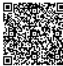
Mémo et astuces pour la photographie de la foudre

e-mail : radiohamelectronic@orange.fr www.radio-cb-services.com www.radiohamelectronic.com